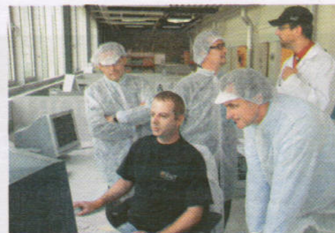
Eine der wichtigsten Abteilungen im Haus - die Druckvorstufe mit modernster Druckplattenstraße.